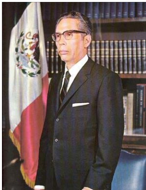
Gustavo Díaz Ordaz 1964 – 1970

Promovió la industrialización, alentando con créditos a los empresarios mexicanos. Se amplió la infraestructura vial, se construyeron muelles y aeropuertos, se instalaron centros de telecomunicaciones. Se originó la fundación Mexicana del cobre, la Siderúrgica Lázaro Cárdenas-Las Truchas y el consorcio de Peña Colorada. Se exploraron, perforaron y habilitaron nuevos pozos petroleros, se terminaron ocho plantas de refinación. Se creó el Instituto Mexicano de Petróleo. Aumento notablemente la red eléctrica. Inauguró el Sistema de Transporte Colectivo Metropolitano de la Ciudad de México conocido como el Metro.