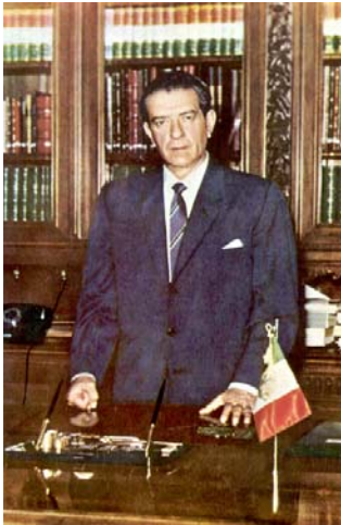
El Lic. Adolfo López Mateos 1958 – 1964

Su política se caracterizó por la nacionalización de las empresas de manera que el Estado consiguió el control total de la industria eléctrica. Se construyeron nuevas vialidades, se estableció el servicio de comunicación marítima de Sinaloa y Sonora a Baja California. Se fundó el Instituto Nacional de Protección a la Infancia (INPI). También el Instituto de Seguridad y Servicios Sociales de los Trabajadores. Se dio continuidad a la producción petrolera y se creó el Fideicomiso para la Investigación y Fomento de Minerales No Metálicos. Se elaboró la Ley Federal de los Trabajadores al Servicio del estado, la ley de Seguridad Social para las Fuerzas Armadas, la Ley del Seguro Agrícola Integral y Ganadero, la Ley Orgánica de las Secretaría de la Presidencia, la del Patrimonio Nacional, Obras Públicas y Departamento de Turismo, la Ley Federal del Trabajo, el Código Fiscal de la Federación.